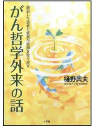
「いい覚悟で生きる」「がん哲学外来の話」