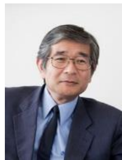
順天堂大学医学部教授 樋野興夫先生