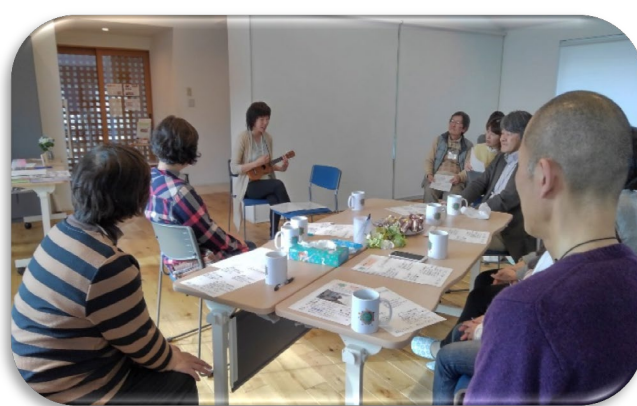
平成31年 2月 日和山カフェの様子