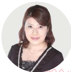
NPO法人 インターナショナル ネイルアソシエーション