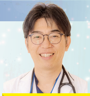
平成11年金沢大学医学部卒業